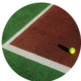
ARAUAK ETA MUGAK FAMILIAN