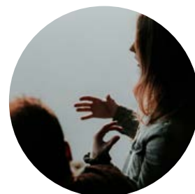
SEXUALITATEARI BURUZ HITZEGITEN