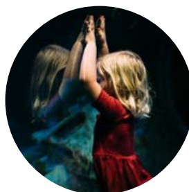
BULLYING: ERAGILEA EDO HARTZAILEA?